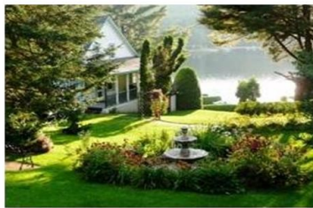
Chalets aux Crocollines www.chalets-crocollines.com 819- 428-9262